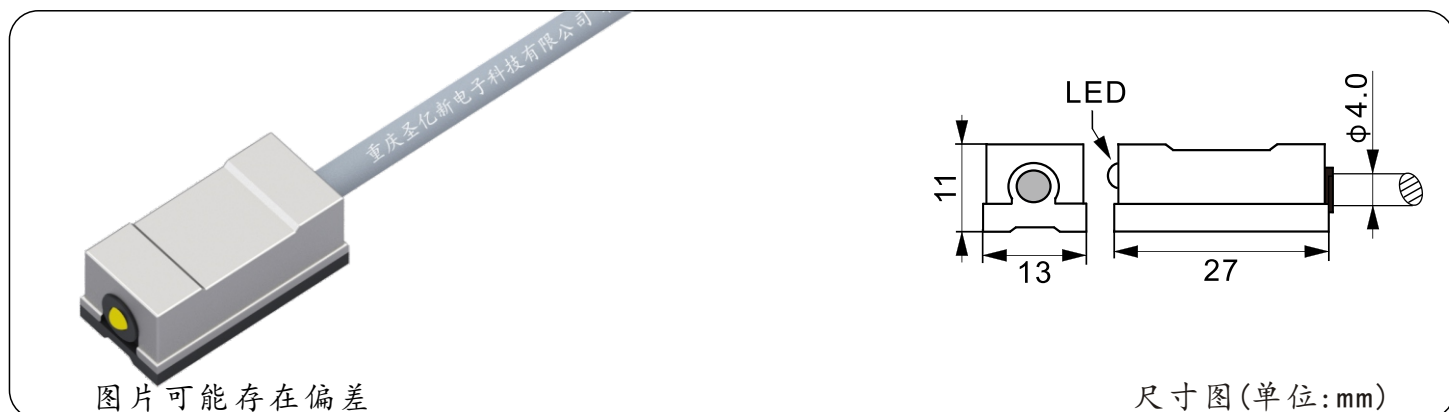
图片可能存在偏差